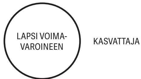
Kuvio 1. Voimavaraympyrä

kuvata voimavaraympyrän avulla (ks. kuvio 1). Ympyrä kuvaa aikuisten asettamia rajoja, joiden sisäpuolella valta on suurimmaksi osaksi lapsen käsissä ja ulkopuolisilla alueilla aikuisilla. Rajat asetetaan lapsen käytettävissä olevien voimavarojen mukaisesti: mitä enemmän lapsella on psyykkisiä, fyysisiä ja sosiaalisia voimavaroja, sitä laajempi hänen alueensa on. Voimavaraympyrä on sovellus Keijo Tahkokallion (2001) esittämästä itenäisyysympyrästä, jonka sisäpuolella on lapsen itsesääntelyn ja itsenäisen kasvun alue ja ulkopuolella aikuisen kasvatus- ja määräysvalta.